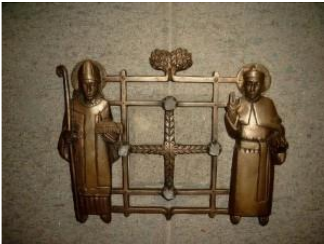
Fingerreliquiar des hl. Engelbert in Solingen

Alles geben; denn auch Jesus hat sich selbst ganz hingegen