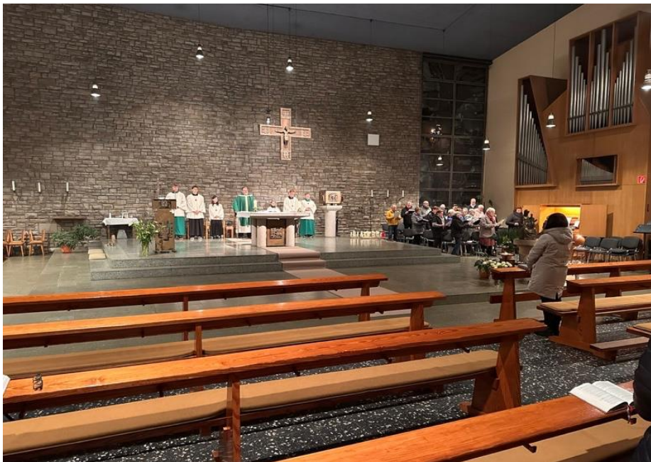
Texte und Fotos: Herman Bohse